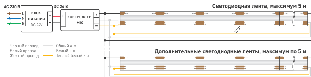
Схема 1. Подключение нескольких светодиодных лент с двух сторон